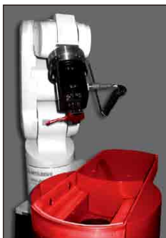
ロボットアーム付