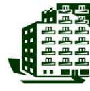
生活環境 (煙感知器、有害物質測定等)

！ 放射性物質は、その取り扱い方によっては、放射線障害が生じる可能性もあります。 ！ そのため、一定の量や濃度を超える放射性物質を所持又は使用等する場合には「放射性同位元素等による放射線障害の防止に関する法律」や「核原料物質、核燃料物質及び原子炉の規制に関する法律」等の規制を受け、あらかじめ、これら法律に基づく、許可を受け又は届出をし、技術上の基準等を遵守する必要があります。