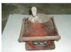
計測機器用の線源