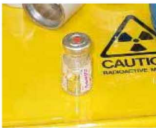
研究用の非密封線源