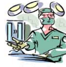
医 療 (診断、ガン治療等)