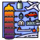
工 業 (滅菌、計測等)