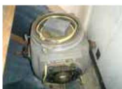
しゃへい体 (劣化ウラン)