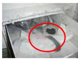
冷凍庫・冷蔵庫内