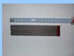
校正用線源（放射能が少量のもの） タングステン溶接棒

このような機器には☢は、ついていないものが多くみられます。このようなものは普通に使用していて問題ありません。