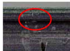
組織内照射用線源