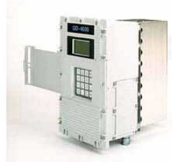
計測機器用の線源 (写真は配管検査用の密度計)