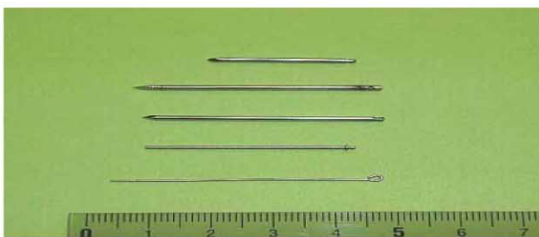
組織内照射用線源 (人体内に挿入し癌治療などに用いる)