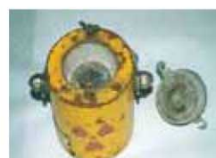
遮へい容器中の線源

発見したら不用意に触ったり動かしたりせず直ちに次ページのとおり連絡してください。