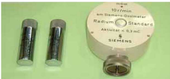
機器の校正用の線源