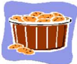
農 業 (発芽抑制、害虫駆除)

○核燃料物質：天然ウラン、劣化ウラン、濃縮ウラン、トリウム、プルトニウムをいいます。 ○核原料物質：ウラン鉱、トリウム鉱その他核燃料物質の原料となる物質をいいます。